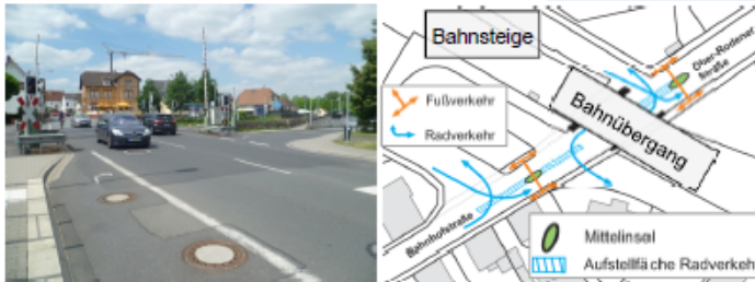
Bahnübergang Bahnhofstraße/ Ober-Rodener Straße (links) und Prinzipskizze für Querungsmöglichkeiten südlich und nördlich des Bahnübergangs (rechts, Foto und Skizze LK Argus)