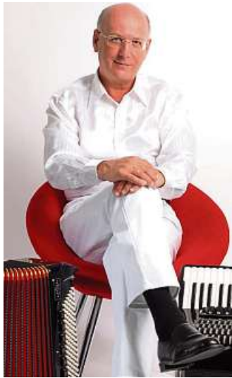
Alexandre Bytchkov

„Die Kirche wird durch zahlreiche Kerzen in einem besonderen Licht erstrahlen“, kündigen die Organisatoren der Adventsveranstaltung an. Der Eintritt ist frei. Es wird um Spenden am Ausgang gebeten.