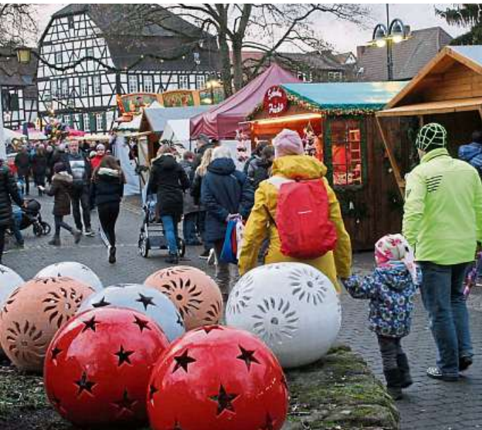
Alle Jahre wieder ein Besuchermagnet: der Dreieichenhainer Weihnachtsmarkt.

• 2. Adventswochenende Besuchermagnet, und das zum 41. Mal, ist am Samstag von 15 bis 20.30 und am Sonntag von 14 bis 20 Uhr der Weihnachtsmarkt in Dreieichenhain . An beiden Tagen strahlen die Altstadt und das Burggelände in schönstem weihnachtlichen Glanz. In Langen folgt (analog zum vorangegangenen Wochenende) Markt Nummer 2. Der Nikolausmarkt auf dem Häfnerplatz in Urberach bittet am Samstag von 15 bis 22 Uhr und am Sonntag von 14 bis 20 Uhr zum Stelldichein. Ebenfalls am Samstag von 16 bis 22 Uhr und am Sonntag von 15 bis 21 Uhr lockt der Adventsmarkt in Nieder-Roden auf den dortigen Platz an der Sankt-Matthias-Kirche. In Heusenstamm erstrahlt die Altstadt vom Torbau bis zum Schloss am Samstag von 15 bis 21 Uhr und am Sonntag von 14 bis 19 Uhr im Lichterglanz einer Vielzahl von Marktständen. Im Herzen von Mühlheim (vor der St. Markus-Kirche) geht es am Samstag von 15 bis 21 Uhr und am Sonntag von 14 bis 19.30 Uhr munter zu. Komplettiert wird das Spektrum von Walldorf , wo am Samstag (15 bis 21 Uhr) und am Sonntag (14 bis 20 Uhr) in der Altstadt rund um die evangelische Kirche gebummelt werden kann. Zu zauberhaftem Hüttenglanz rund um Brehms Hütte lädt die