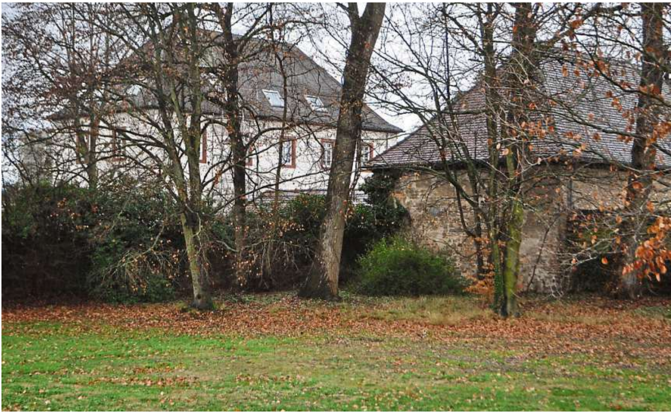
Links die historische Schlossmühle, rechts die Scheune: So präsentiert sich das Ensemble, über dessen Kita-Tauglichkeit in Heusenstamm gestritten wird, dem Betrachter, wenn er durch den Vorgarten des Rathauses schlendert.

Seither wird jedoch auf der kom- munalpolitischen Bühne mit teil- weise großer Erregung munter weiter über das Pro und Contra debattiert. So wie unlängst: In der jüngsten Sitzung der Stadt- verwordneten wollte der Magistrat einen Beschluss getreu der Devise „Verabschieden wir uns end- gültig von dieser Sache“ herbei- führen. Doch die Fraktionen von CDU, AfD und FDP pochten auf die einstige Grundsatz-Entschei- dung. Frei nach dem Motto: „Schluss mit dem ewigen Auf- schub. Die Verwaltungsspitze soll endlich handeln, die Handwerker anrücken lassen und die Kita startklar machen.“ Eine Haltung, die vom Rest des Parlaments (SPD, Grüne, Freie