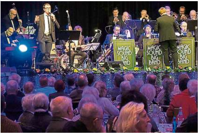
Die „Magic Sound Bigband“ huldigte den Größen des Swing-Genres.