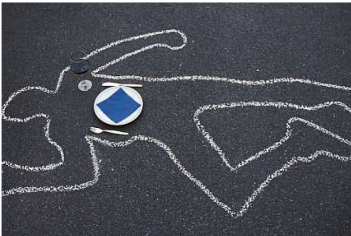
Abende „voller Genuss, Spannung und Unterhaltung“ erleben die Teilnehmer bei den „Mordsmenüs“ in Groß-Zimmern.