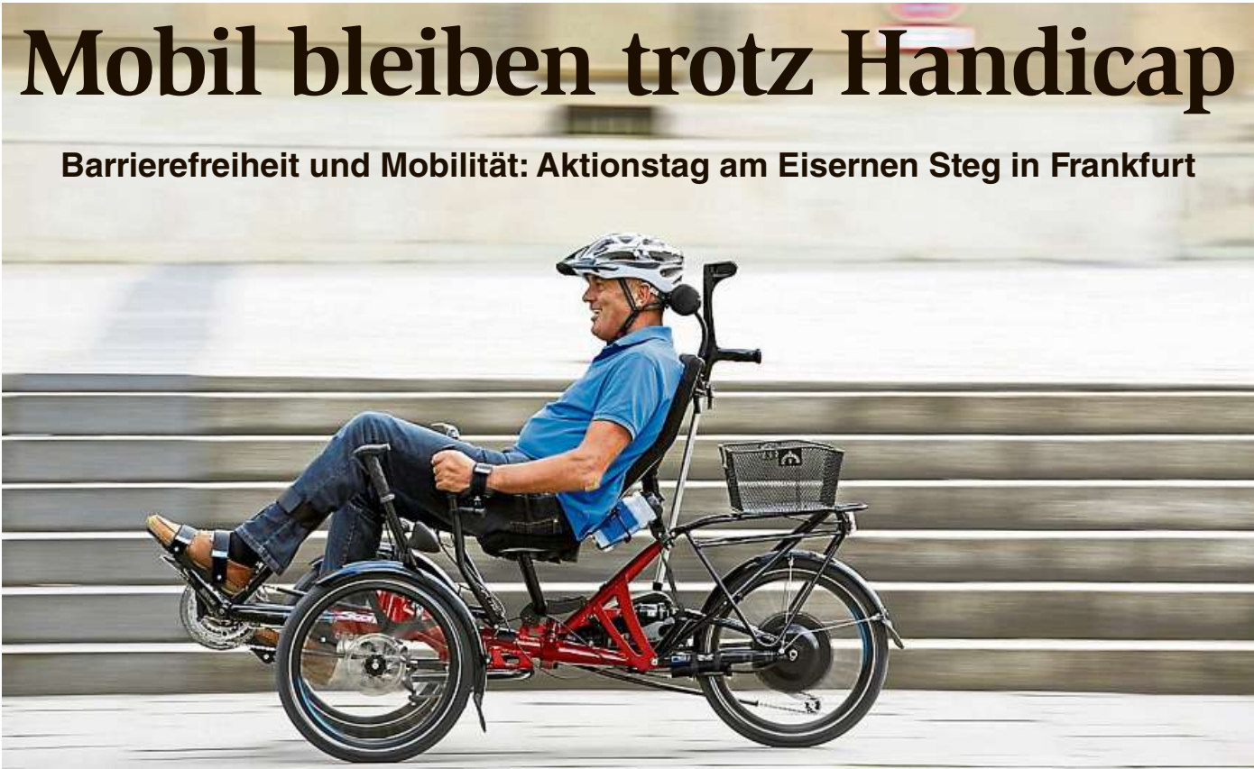
Auch Liegedreiräder von der Krifteler Manufaktur HP Velotechnik können beim Aktionstag am 21. August am Eisernen Steg

RODGAU (kö). Immer nur Süßigkeiten für die Schultüte? Wie wäre es mit einer Alternative? Die Rodgauer Stadtbücherei hat das passende Angebot: Während der Sommerferien gibt es kostenlose Schulstarttaschen für die ABC-Schützen. Die Kinder können sich über einen Bücherei-Ausweis zum Nulltarif und andere kleine Überraschungen freuen. Erhältlich sind die Pakete, die den Einstieg in die neue Lebensphase leichter machen sollen, in der Bücherei am Puiseauxplatz in Nieder-Roden. Die dortigen Öffnungszeiten: montags von 15 bis 19 Uhr, dienstags bis donnerstags von 9 bis 13 Uhr und von 15 bis 19 Uhr sowie freitags von 9 bis 13 Uhr und von 15 bis 18.30 Uhr. Nähere Auskünfte gibt es unter der Rufnummer (06106) 6931322.