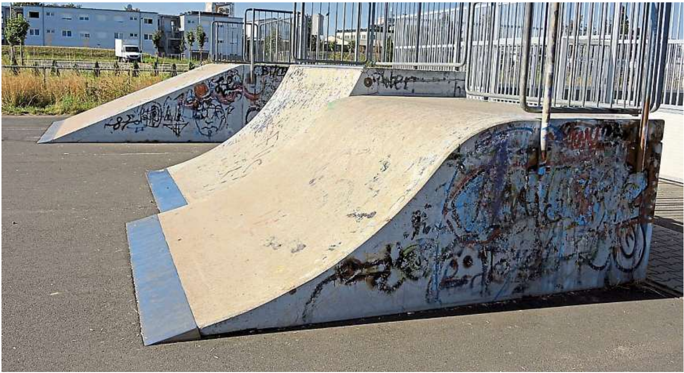
Blick auf den Dietzenbacher Skaterpark an der Ober-Rodener Straße: Youngster, die ins Beteiligungsprojekt eingebunden sind, wollen die Anlage mit Ideen und Farbe auf Vordermann bringen.

Und heutzutage? Dietzenbach versucht es seit knapp einem Jahr mit dem Modell der „Jugendbeteiligung“. In den weiterführenden Schulen der Kreisstadt sowie in Vereinen und Glaubensgemeinschaften wurden Vertreter der Hauptzielgruppe – grob gesprochen: der Jahrgänge 2002 bis 2007 – persönlich angesprochen und gefragt: „Hättet ihr nicht Lust, euch sozial zu engagieren? Die ‚junge Sicht‘ ist gefragt.“ Daraufhin erschienen im November 2019 rund 60 Interessierte zu einer Vorbesprechung in großer