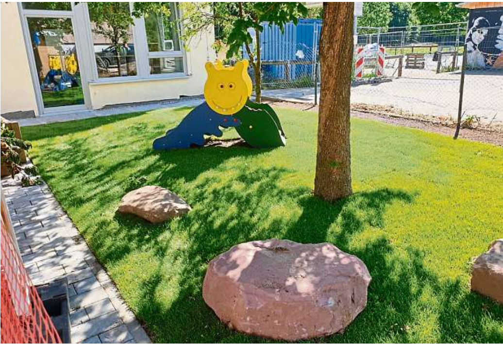
In neuem Glanz erstrahlt auch der Außenbereich der Kita im Stadtteil Heubach. Die dortigen Maßnahmen sowie jene im Inneren des in die Jahre gekommenen Gebäudes wurden zum Großteil von Bund und Land finanziert.

GROSS-UMSTADT (hsa). An der Kita im Stadtteil Heubach hatte der Zahn der Zeit spürbar genagt. Denn das Gebäude war 1976 errichtet worden und somit eine umfassende bauliche und energetische Sanierung dringend erforderlich. Aber auch bei den Außenanlagen bestand Handlungsbedarf – und so wurde die Einrichtung in Trägerschaft der evangelischen Kirche, deren Eigentümer aber die Kommune ist, von Oktober vorigen bis Mai diesen Jahres umfassend auf Vordermann gebracht.