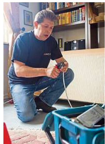
Der Fachmann hilft.

GROSS-ZIMMERN (red). Gestiegene Energiekosten, schlechte Steuerbarkeit: Viele Haus- und Wohnungsbesitzer machen sich Gedanken darüber, mit welchem Heizsystem man die Nachtspeicher sinnvoll ersetzen kann. Man sucht die optimale Lösung, möglichst ohne zu hohe Kosten und Baustelle im Haus. Insbesondere für Haushalte mit veralteten Nachtspeicher/Elektroheizungen gibt es eine echte Alternative: Dynamische Elektro-Teilspeicherheizungen – ein sparsames, modernes und zukunftsorientiertes Elektro-Heizsystem, welches durch seine dynamische Speichertechnik (ohne Vorheizen) mit Strahlungswärme (Infrarotanteil) in Verbindung mit Konvektion (kein Gebläse) ein wesentlich angenehmeres Raumklima schafft, als es mit Nachtspeichern möglich war. Mit qualitativ hochwertigen und voll optimierten Elektro-Teilspeicherheizungen (automatische Nachtabenkung) können zum Beispiel ohne große Umstände und Baustelle die alten Nachtspeicher ersetzt werden. Per Wandmontage unter Verwendung der bereits bestehenden (Elektroheizungs-) Anschlüsse in nur einem Tag. Mit etwa dem halben Anschlusswert gegenüber Nachtspeichern wird auf einen gesteuerten Heiztarif umgestellt. Aus den Differenzen von Anschlusslast, Laufzeiten