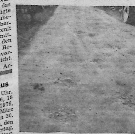
wird eine 3 Meter breite Asphaltdecke von der Gartenstraße bis zur Anbindung an die Dieburger Straße gegenüber der Volksbank vorhanden sein.

Der SVR weist noch einmal alle Bürger Ober-Rodens darauf hin, noch gebrauchsfähige Möbelstücke nicht wegzuerwerfen, sondern sie für das Jugendhaus zur Verfügung zu stellen. Es werden noch Tische, Stühle, Büroschränke, Kühlschränke, Garderoben und ein Elektroherd benötigt. Sollten Sie Altmöbel abgeben wollen, rufen Sie bitte die Gemeinde Ober-Roden, Herrn Böhm (9 00 77), an. Ein Mitglied des SVR wird dann zu Ihnen kommen und alles weitere besprechen.