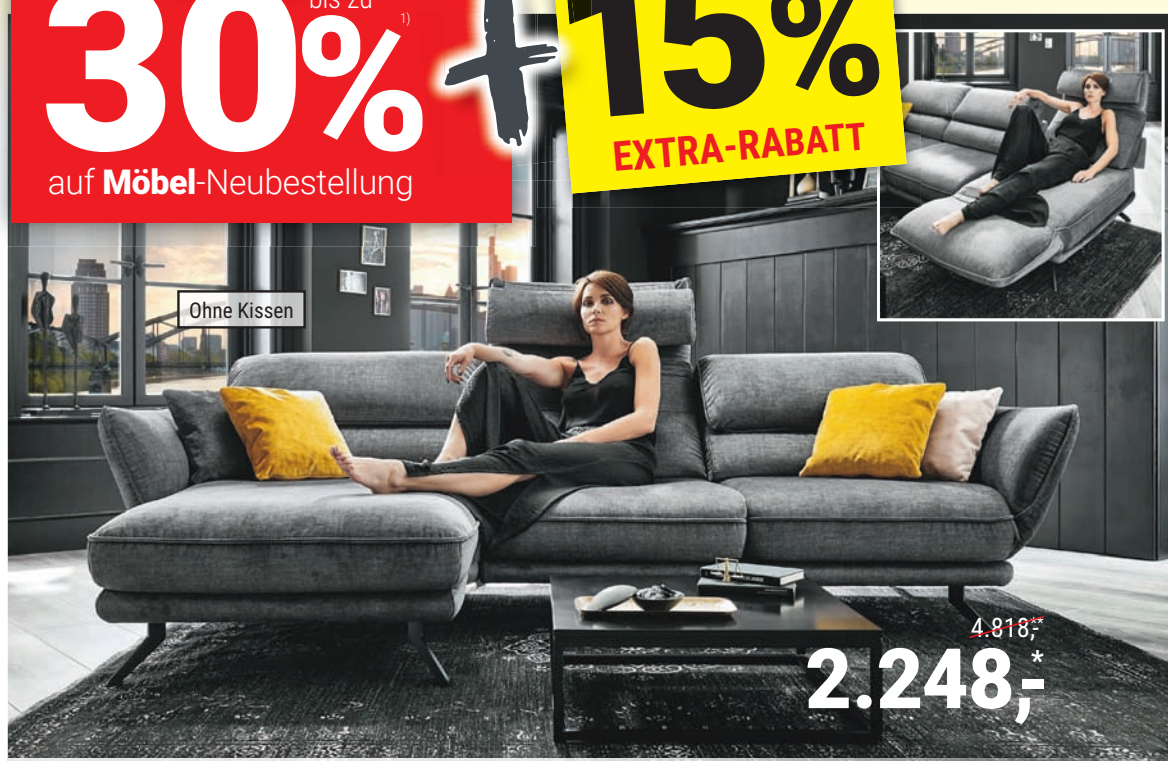
POLSTERKOMBINATION , Bezug Stoff grau | Canape links, Sofa 2,5-Sitzer rechts | Fuß Metall schwarz | Maße ca. 153x283x98cm | andere Bezüge zum Aufpreis möglich | Art.Nr. 496346-01