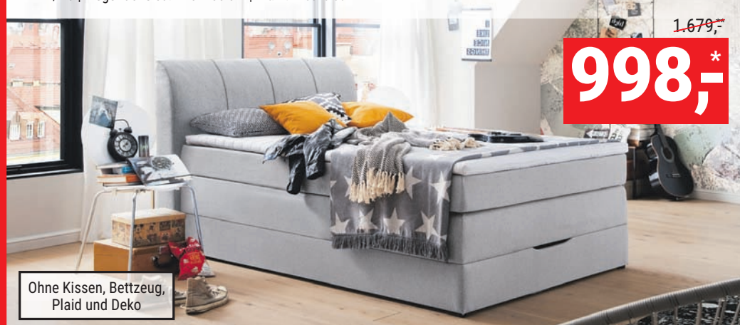
BOXSPRINGBETT , Bezugsstoff hellgrau | Inklusive Topper und großem Bettkasten | Wendematratze Taschenfederkern in H2/H3 | Liegefläche ca. 140x200 cm | Art.Nr. 470093-06