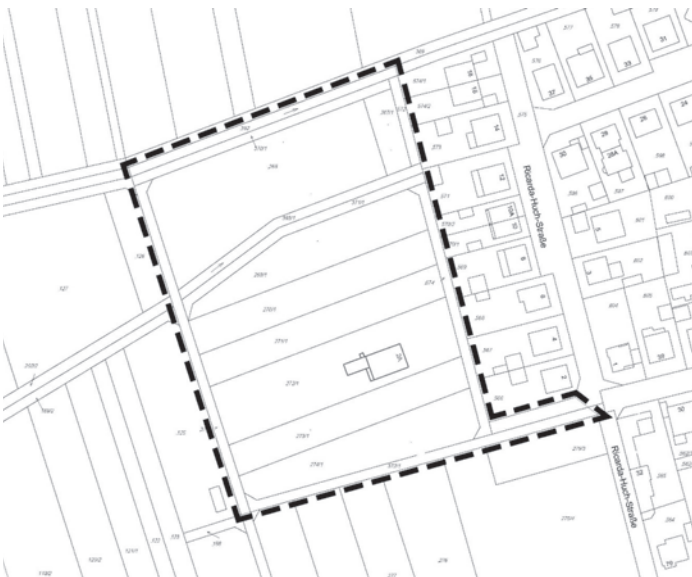
Karte: Stadt Rödermark

Die Grenze des räumlichen Geltungsbereiches des Bebauungsplanes wird durch die zeichnerische Darstellung bestimmt.