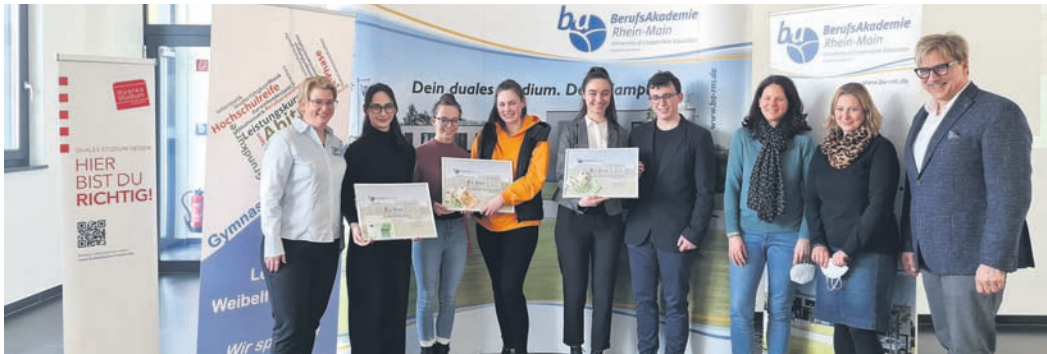
Als Anerkennung für die drei besucherstärksten Schulen zum Speed-Dating und Tag der offenen Tür an der BA Rhein-Main erhielten die Schüler*innen einen Zuschuss zur Abi-Kasse.

Reichstagsabgeordneter bis 1933 von den Nationalsozialisten im KZ Osthofen inhaftiert wurde. Nach dem Krieg war er am Wiederaufbau der Gewerkschaften beteiligt und bis 1949 Vorsitzender der Metallgewerkschaft in Offenbach. Die SPD bedankt sich ausdrücklich bei der Stadt Rödermark und den Mitarbeitern für die Unterstützung der Aktion durch die kompetente Beratung und praktische Hilfe.