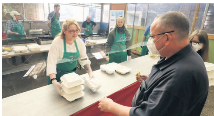
Insgesamt 16 Helfer waren am Karfreitag beim Backfischessen im Einsatz.