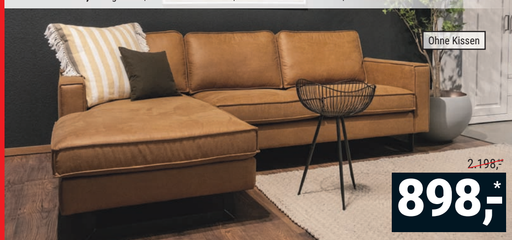
POLSTERECKE , Bezug braun | schwarze Metallkufe | Maße ca. 238x85x170 cm | Art.Nr. 470602-07