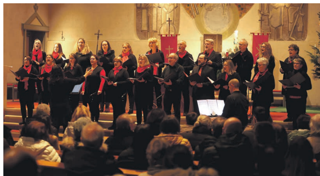
Am Sonntagnachmittag freuten sich die Rejoice-Chöre über ein gut besuchtes Konzert in der St. Gallus-Kirche.

Rödermark (NHR) Dringende Regulierungsarbeiten an einigen Straßenschächten haben vom 13. bis zum 19. Dezember Verkehrsbehinderungen im Stadtgebiet zur Folge.