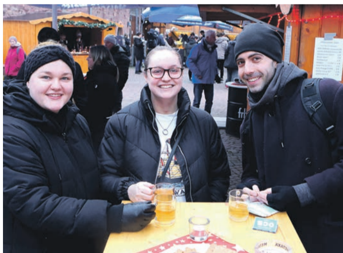
Am Sonntag blieb es zur Freude der Besucher des Nikolausmarktes weitgehend trocken.