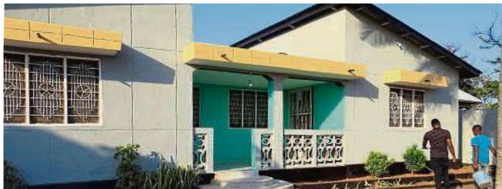
Die Inneneinrichtung fehlt noch: Peter Keller sammelt weiter Spenden für das Waisenhaus.

Auf dem etwa 900 Quadratmeter großen Grundstück befindet sich ein Doppelhaus mit zwei Service-Anbauten. Dies bietet ausreichend Platz für zwei Schlafräume, eine Küche, einen Ess- und Aufenthaltsraum sowie ein Lern-