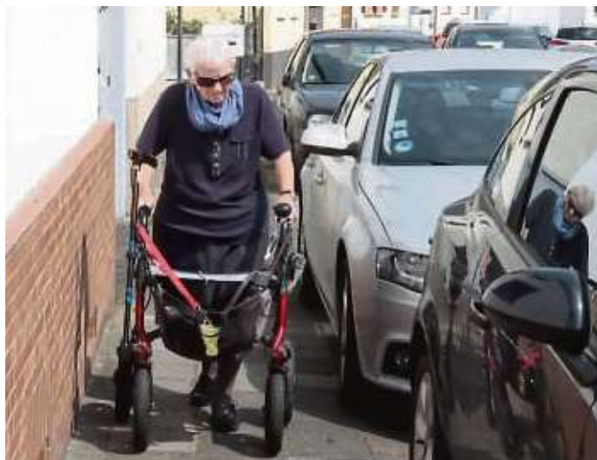
Das hat gerade noch geklappt: Parkende Autos sind für Rollatorfahrer in der Doktor-Weinholz-Straße ein Problem.