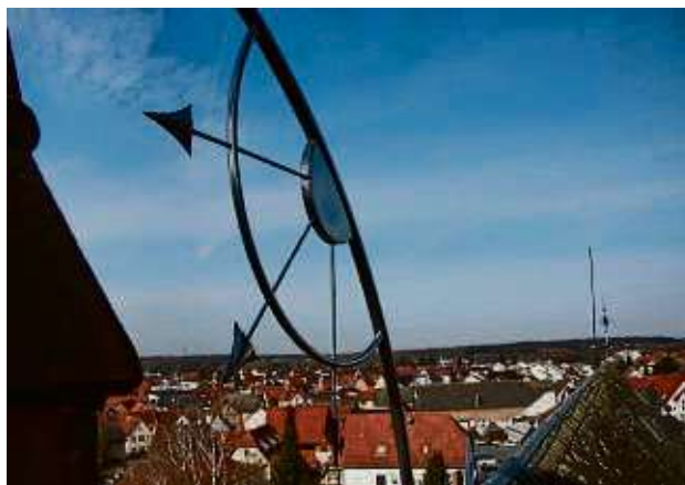
Sogar der Blick vom fast 53 Meter hohen Kirchturm aufs sanierungsbedürftige Dach des Rodgaudoms ist beim virtuellen Rundgang möglich.