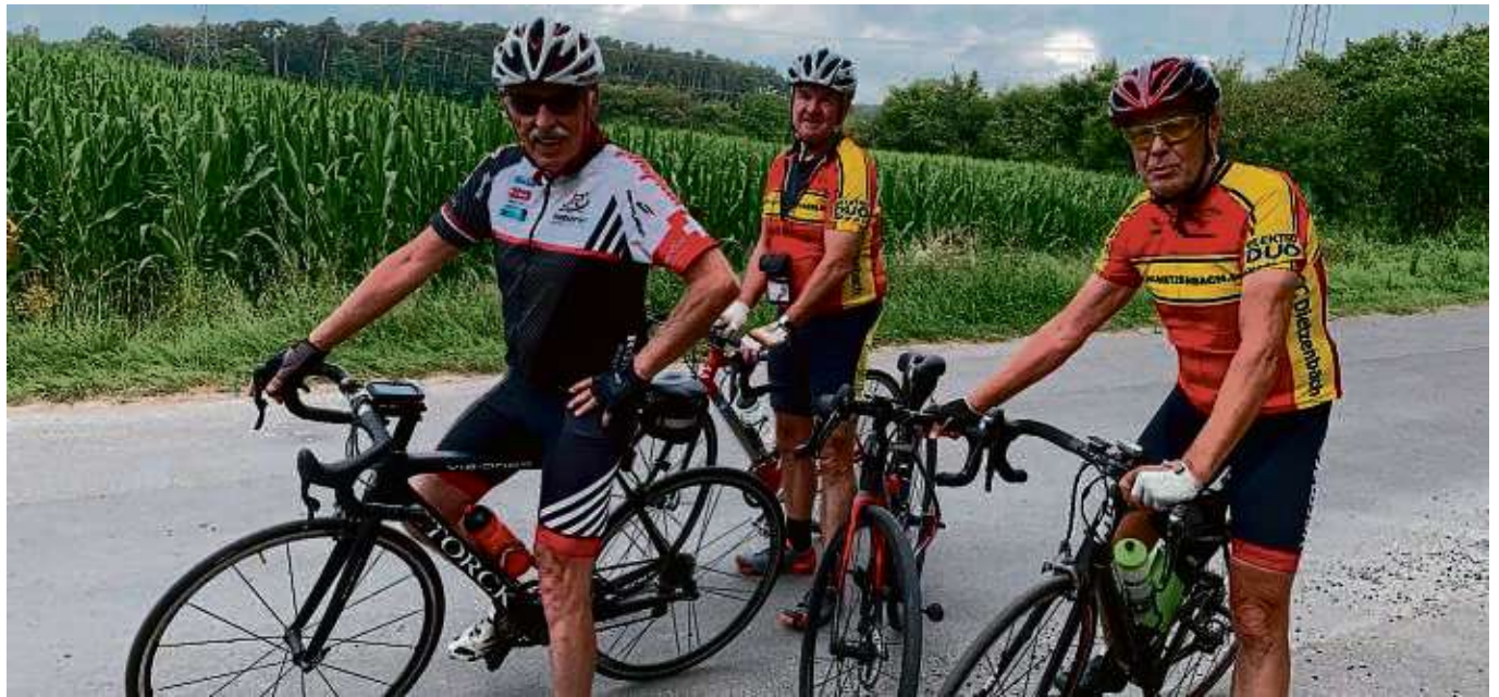
Die körperliche Fitness erhalten: Rennradfahrer fahren Touren bis zu 100 Kilometer.

Die Radler lernen bei flotter und zügiger Fahrt nicht nur die nähere, sondern auch die etwas weitere entfernte Umgebung von Dietzenbach kennen. Vorbei an grünen Wiesen und blühen-