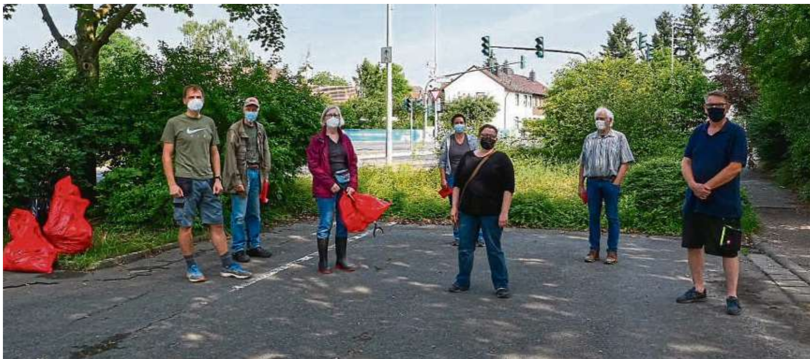
Rund 200 Kilo Dreck klauben die Umweltfreunde Rödermark jeden Monat aus der Landschaft.