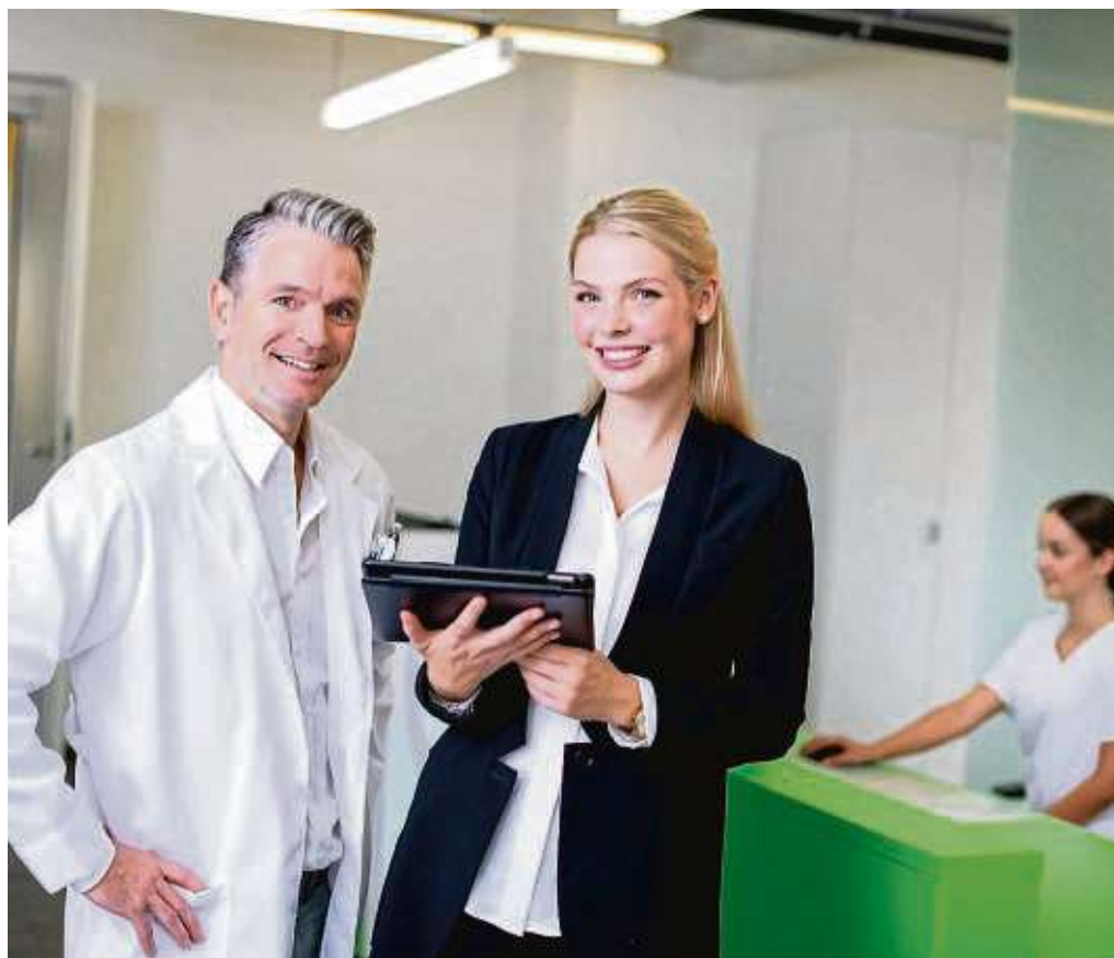
Im Gesundheitswesen ist nicht nur medizinisches Personal, sondern auch kaufmännische Expertinnen und Experten, die organisatorische Aufgaben übernehmen und so den Klinik- oder Praxisalltag am Laufen halten, gefragt.