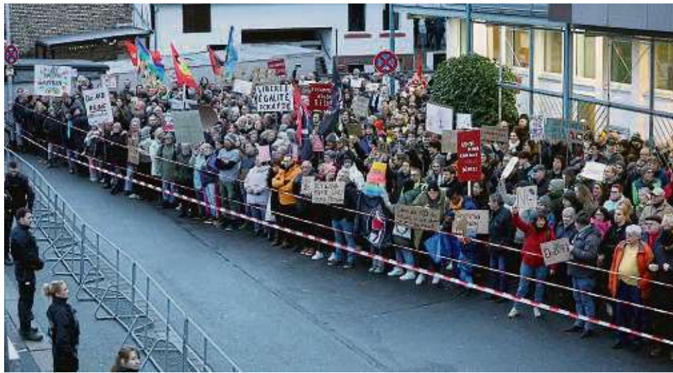
Laut und friedlich demonstrierten rund 1000 Menschen gegen den politischen Aschermittwoch der AfD.