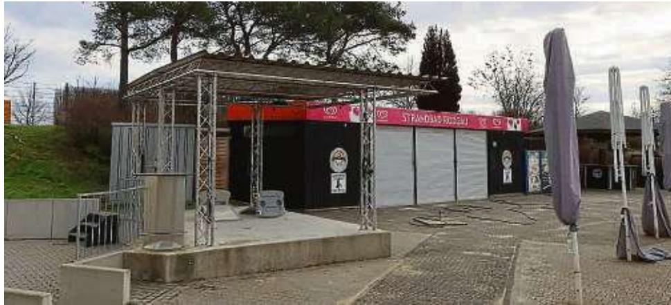
Mehr Platz für Außengastronomie und Bühne sind oberhalb des Textilstrandes geplant.

Nach den Notreparaturen der vergangenen Jahre plant die Stadt nun einen Neubau für die Strandbad-Gastronomie. Bereits beim Bau des Funktionsgebäudes 2020/21 war nach Angaben des Magistrats vorgesehen, „kurz danach einen Neubau für die